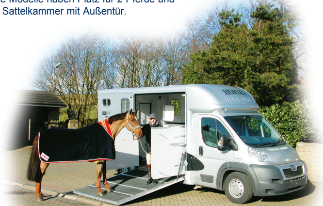
Der Super Sonic

John Whitaker kommentiert: "ich meine, der Equi-Trek Sonic ist mit Abstand der beste, kleine Pferdetransporter